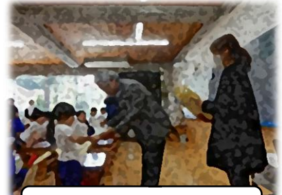
セカンドブック贈呈式

4月22日（水）は、本年度最初の参観日でした。多くの皆さまにご来校いただき、小学校に入学した1年生、ひとつ学年が上がってお兄さん・お姉さんになった2～6年生の姿をみていただくことができました。みんな、3月よりもちょっと「おとな」に一步近づいたような、カッコいい表情をしていたように思いました。1年生の教室では、教育長さんが「セカンドブック」の贈呈をしてくださいました。何も言われていないのにみんな立ち上がって待ち、名前を呼ばれると「ハイ！」と大きな声でお返事をする姿がとても頼もしかったです。